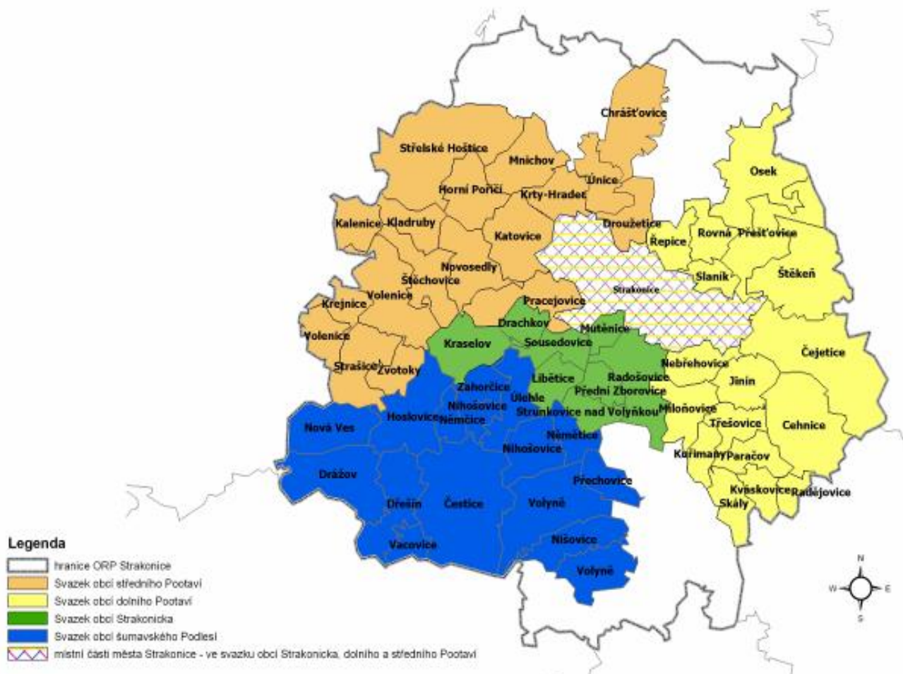
Mapa území MAS Strakonicko, z.s.