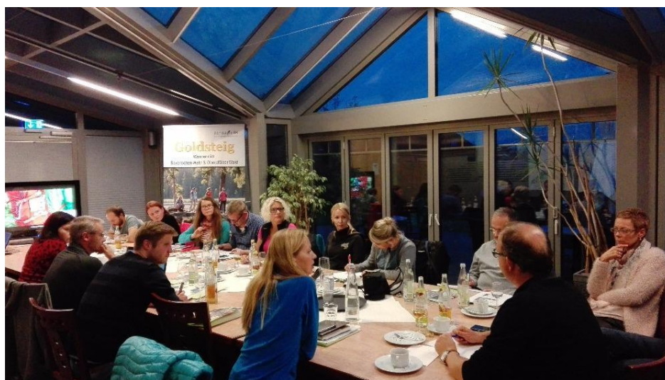
Jednání o projektu Zlaté stezky v Německu. Stezka povede také územím MAS Strakonicko.