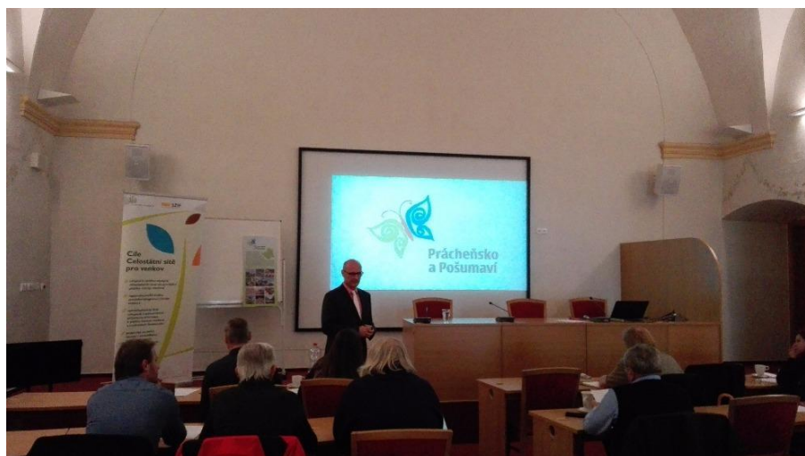
Prezentace destinační společnosti v Plzeňském kraji